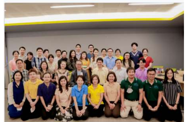
งานบริการการศึกษาและพัฒนาคุณภาพนักศึกษา มข. จัดกิจกรรมการบรรยายพิเศษการวัดการองค์ความรู้ด้านการจัดการศึกษาและหลักสูตรให้แก่วิชากรย์ เรื่อง Constructive Feedback และ Teacher as Facilitator เมื่อวันที่ 3 เมษายน 2566