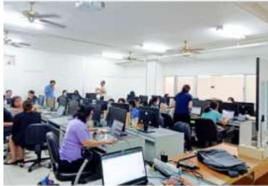
การฝึกอบรมการใช้งาน CMU EXAM เพื่อเป็นการทดแทนใบทดสอบ (Paperless) Test Computer Base