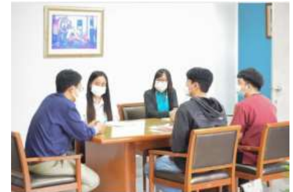
คณะบดีทำของขวัญและของที่ระลึกให้กับพี่เลี้ยงที่ต้อนรับบุคลากรใหม่