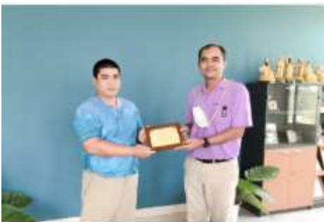
ผู้ช่วย คณบดี (นายแพทย์) และ เลขานุการบดี (นายแพทย์) มอบของที่ระลึกให้กับบุคลากรใหม่ที่ได้รับคัดเลือกให้มาทำงานที่ รพ.อุดรธานี เมื่อวันที่ 27 ธันวาคม 2566