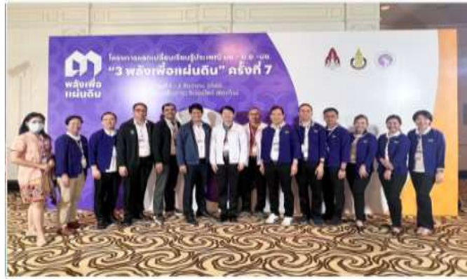
ทีมผู้บริหารคณะสัตวแพทยศาสตร์ มหาวิทยาลัยเชียงใหม่ ร่วมกิจกรรมแลกเปลี่ยนเรียนรู้ ประเพณี มช.-บ.อ.-บ.ช. "3 พลังเพื่อแผ่นดิน" ครั้งที่ 7 ณ โรงแรมเอ็มกาซ่า ริเวอร์ไซด์ เชียงใหม่ เมื่อวันที่ 1 ธันวาคม 2566