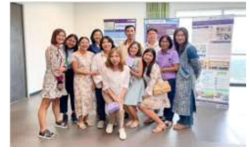
คุณพี่เลี้ยงที่ต้อนรับบุคลากรใหม่ได้รับของที่ระลึกจากคณะบดี และ เลขานุการบดีของสัตวแพทยศาสตร์ มหาวิทยาลัยขอนแก่น เมื่อวันที่ 1 ธันวาคม 2566 ณ โรงแรมดิเรข ซิงโครเนียฮิลล์ จังหวัดขอนแก่น เมื่อวันที่ 16 กรกฎาคม 2566