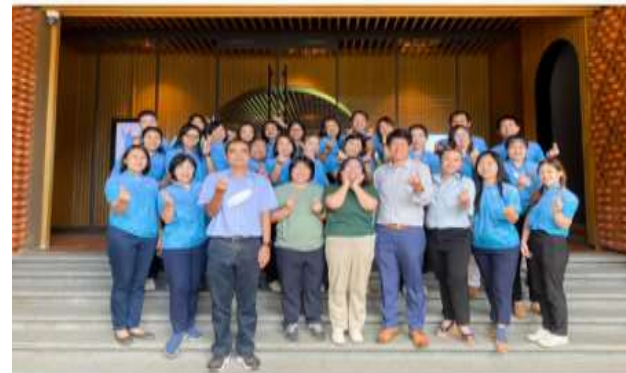
ผู้บริหารคณะสัตวแพทยศาสตร์ และบุคลากรสายสนับสนุน ร่วมกิจกรรมโครงการสามัคคีกันในหน่วยงาน เพื่อสร้างความสามัคคีกัน และความจงรักภักดีในการทำงานแก่หน่วยงานในองค์กร ณ โรงแรมดิเรข ซิงโครเนียฮิลล์ เมื่อวันที่ 27 กรกฎาคม 2566