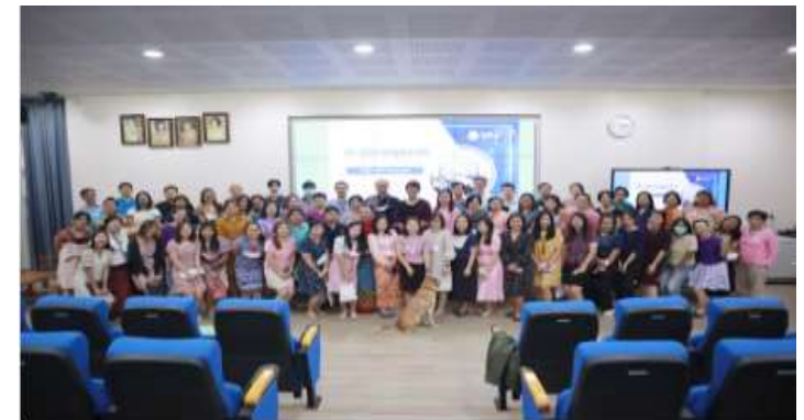
คณะสัตวแพทยศาสตร์ มหาวิทยาลัยเชียงใหม่ จัดการประชุมรวมบุคลากร ครั้งที่ 1/2566 เพื่อเป็นเวทีพบปะพูดคุยกันบนใจของครอบครัวสัตวแพทย์ มหาวิทยาลัยเชียงใหม่ แลกเปลี่ยนเรียนรู้และขอผลการทำงานด้านการจัดการสัตวแพทย์ศาสตร์ ครอบคลุม 10 เมื่อวันที่ 18 เมษายน 2566

งานนโยบายและแผนและประกันคุณภาพการศึกษา คณะสัตวแพทยศาสตร์