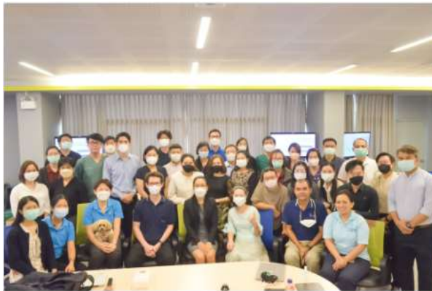
กิจกรรมอบรมการจัดการองค์ความรู้ด้านการจัดการศึกษาและหลักสูตรให้แก่อาจารย์ ชาติโดย จากบริการการศึกษาและพัฒนาคุณภาพนักศึกษา สำหรับเป็นแนวทางการนำความรู้ไปประยุกต์ใช้ในการสอนในชั้นเรียน เมื่อวันที่ 1 ธันวาคม 2566