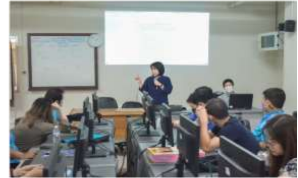
มหาวิทยาลัย คณะสัตวแพทยศาสตร์ มหาวิทยาลัยเชียงใหม่ ฝึกอบรมและทดสอบวิธีการใช้งานระบบวิดีโอคอนเฟอเรนซ์เพื่อจัดการเรียนการสอนแบบเป็นสตูดิโอ เป็นโปรแกรมคอมพิวเตอร์สำหรับงานการสอนแบบเป็นสตูดิโอสำหรับสไลด์นิ่ง เมื่อวันที่ 3 กุมภาพันธ์ 2566