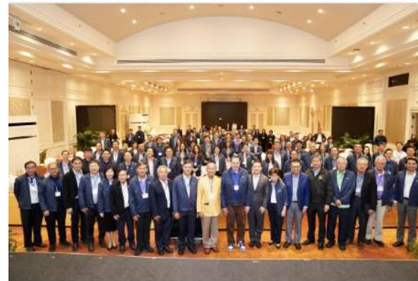
คณบดีคณะสัตวแพทยศาสตร์ มช. ร่วมงานสัมมนาเรื่องความคิดเห็นเชิงนโยบาย (Retreat) ระหว่างกรรมการมหาวิทยาลัยและผู้บริหารมหาวิทยาลัย ประจำปี 2566 เรื่อง 'World changes and University' ระหว่างวันที่ 28-29 ตุลาคม 2566 ณ โรงแรมดุสิตธานี หัวหิน จังหวัดประจวบคีรีขันธ์