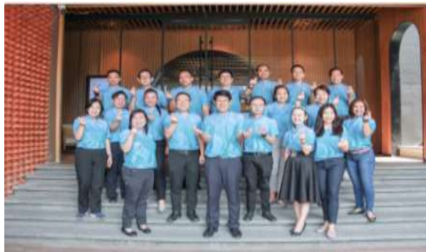
พิธีมอบโล่แก่ผู้บริหารคณะสัตวแพทยศาสตร์ มหาวิทยาลัยเชียงใหม่ เพื่อทบทวนวิสัยทัศน์ เป้าหมาย และยุทธศาสตร์วิสัยทัศน์คณะสัตวแพทยศาสตร์ ปี พ.ศ. 2567- พ.ศ. 2569 พร้อมรางวัลมอบแก่ผู้เกษียณราชการสำหรับชีวิตที่ผ่านมามีคุณูปการ ปี พ.ศ. 2567 เมื่อวันที่ 8 พฤษภาคม 2566