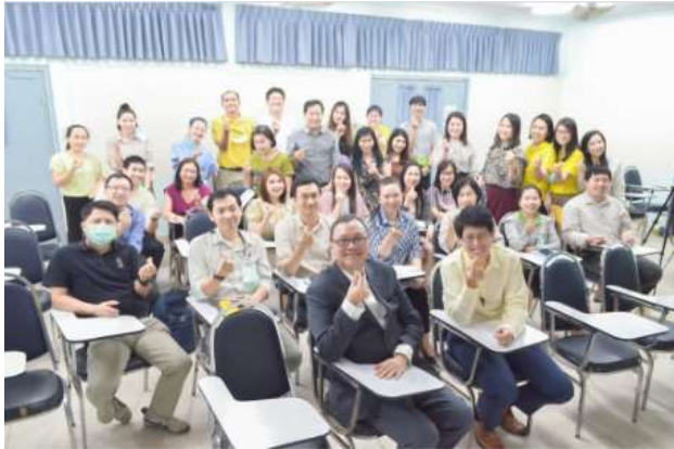
การบรรยายพิเศษในหัวข้อ "แนวทางการมองภาพอนาคตของคณะสัตวแพทยศาสตร์โรงพยาบาลรามาธิบดีภายใต้การเปลี่ยนแปลงของโลกในยุคการพัฒนาระบบดิจิทัลอย่างยั่งยืน" เมื่อวันที่ 27 กุมภาพันธ์ 2566