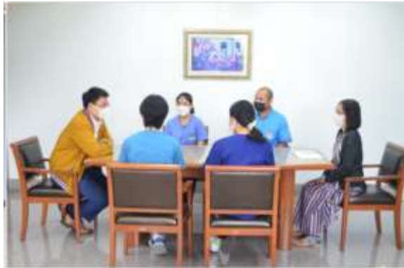
เป็นบุคลากรใหม่ที่มีประสบการณ์ในสายวิชาชีพมานาน 2565 เข้ามา พบ ผอ.สพ.รพ.อุดรธานี (นายแพทย์) คณะบดี คณะสัตวแพทยศาสตร์ (นายแพทย์) และผู้บริหาร เพื่อต้อนรับบุคลากรใหม่ให้สามารถปรับตัวและทำงานร่วมกับทีมได้