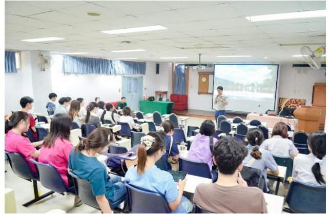
นักศึกษาชั้นปีที่ 6 วันที่ 9 พฤศจิกายน 2566