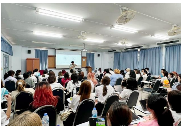
นักศึกษาชั้นปีที่ 3 วันที่ 15 พฤศจิกายน 2566