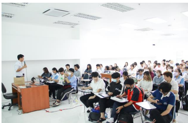
นักศึกษาชั้นปีที่ 1 วันที่ 21 พฤศจิกายน 2566