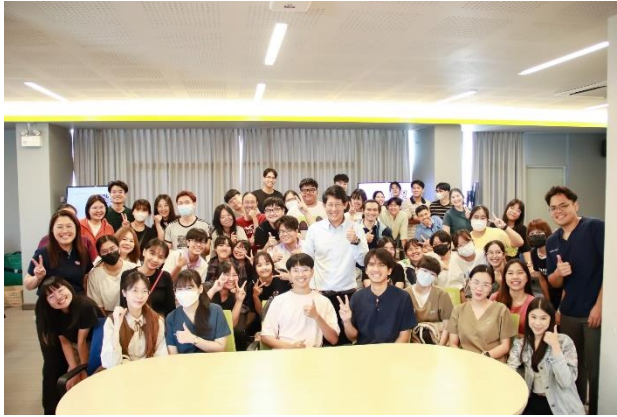
นักศึกษาชั้นปีที่ 5 วันที่ 5 ธันวาคม 2566