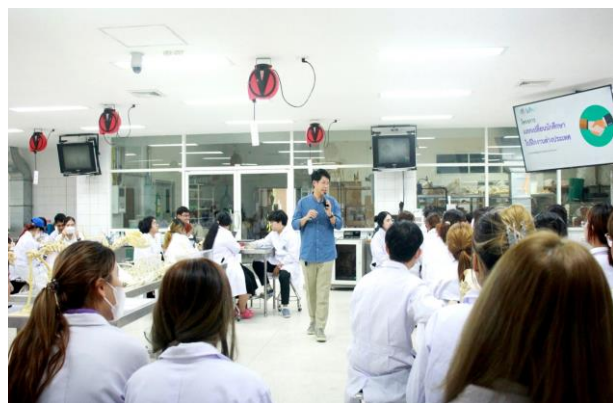
นักศึกษาชั้นปีที่ 2 วันที่ 16 พฤศจิกายน 2566