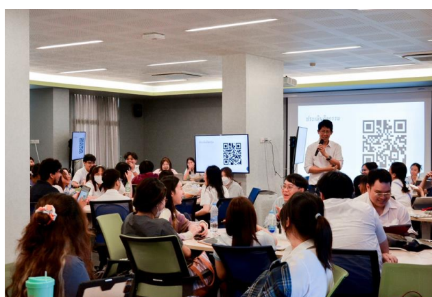
นักศึกษาชั้นปีที่ 4 วันที่ 15 พฤศจิกายน 2566