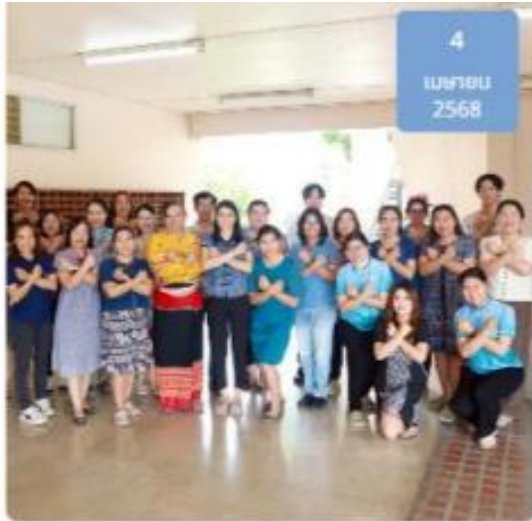
คณะสัตวแพทยศาสตร์ มหาวิทยาลัยเชียงใหม่ จัดการประชุมปูเสื่อ ประจำเดือน เมษายน ซึ่งเป็นเวทีสำหรับบุคลากรสายสนับสนุน เพื่อแลกเปลี่ยนข้อมูล ข่าวสาร และแนวทางการดำเนินงานของคณะฯ อย่างมีประสิทธิภาพ เมื่อวันที่ 4 เมษายน 2568

การประชุมปูเสื่อประจำเดือน วันที่ 4 เมษายน 2568 เพื่อถ่ายทอดนโยบาย No Gift Policy และแนวปฏิบัติ Dos & Don'ts เพื่อลดความสับสนเกี่ยวกับพฤติกรรมสีเทาและเป็นแนวทางในการประพฤติตนทางจริยธรรมให้แก่บุคลากร